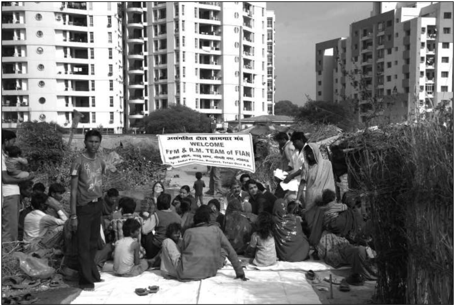
Representanter fra FIAN Norge og FIAN UP på Research Mission i Kathwata-slummen i Lucknow. Slummen befinner seg rett ved siden av moderne boligblokker.